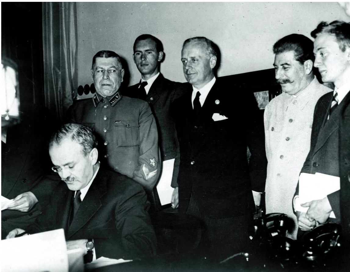
Semnarea Pactului Ribbentrop-Molotov, în 1939. Molotov, ministrul de externe rus, se află pe scaun, în spatele său este Ribbentrop (în centrul imaginii, cu cravată), ministrul de externe al Germaniei naziste; Stalin se află în stânga lui.