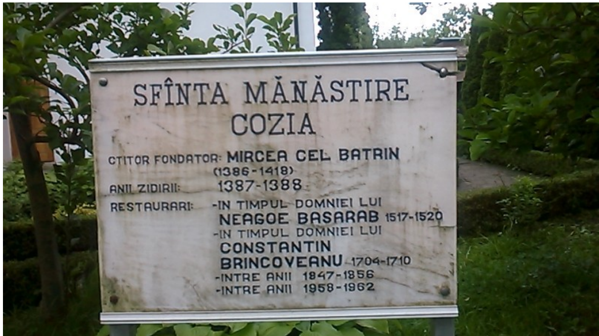
Placa informativa in curtea Manastirii Cozia