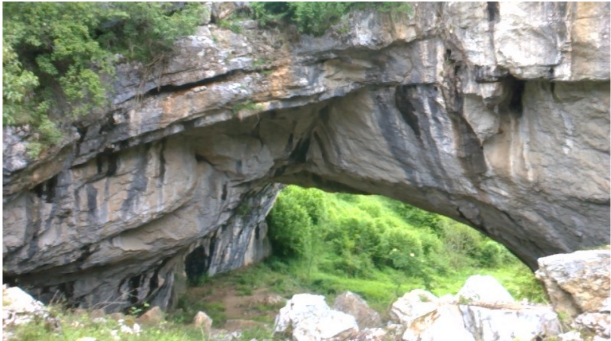
Podul lui Dumnezeu , Ponoarele