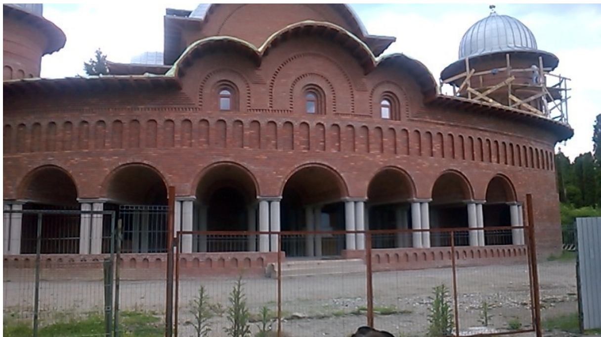
Catedrala in constructie patronata de Familia Regala langa Catedrala Curtea de Arges