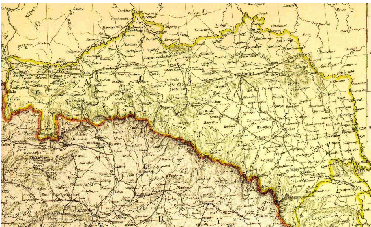
Fig.21. Galiția anexată Austriei

- Austria este frământată opt ani de o criză de succesiune (1740-1748), urmată de alți opt ani de reforme militare și bugetare (1748-1756), după care intră în Razboiul de șapte ani (1756-1763) cu intenția de a-și realipi Silezia. Alianțele din Europa timpului erau interesate de redesenarea sferelor de influență, odată cu apariția Prusiei ca noua mare putere europeană. După război, împărăteasa Maria Theresa continuă să facă reforme în stat, atât privitor la sectoarele vizate anterior, dar și în cel economic (industriile textilelor, oțelului), social (law on Hungary regulating the right and duties of the serf and their lords- 1767, restrângerea obligațiilor de muncă în Bohemia-1775), administrativ (customs union, 1775) și educației publice (General School Regulation-1774). Austria nu a fost doar o observatoare în Razboiul ruso- turc din 1768-1774, din măsură ce a acceptat să se declare fățiș de partea Rusiei și să subscrie propunerii lui Frederick II de a împărți în trei Polonia, în 1772 anexînd Galiția (Fig.21).