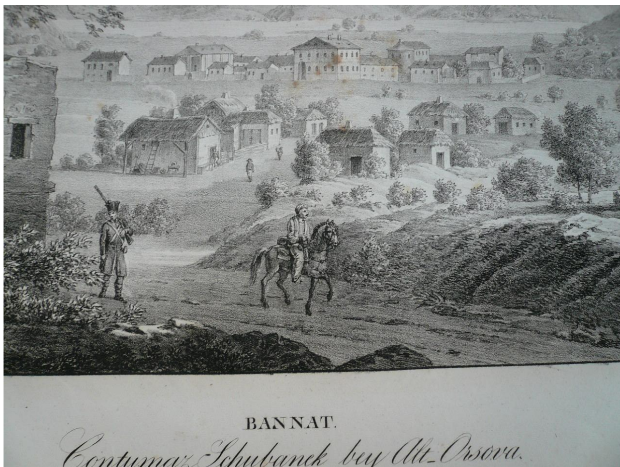
Fig.23. Litografie din anul 1825 prezentând Lazaretul de la Jupalnic

La Jupalnic se infiintează un Internat/Lazaret/Contumatz/Loc de izolare (Fig. 23), pentru