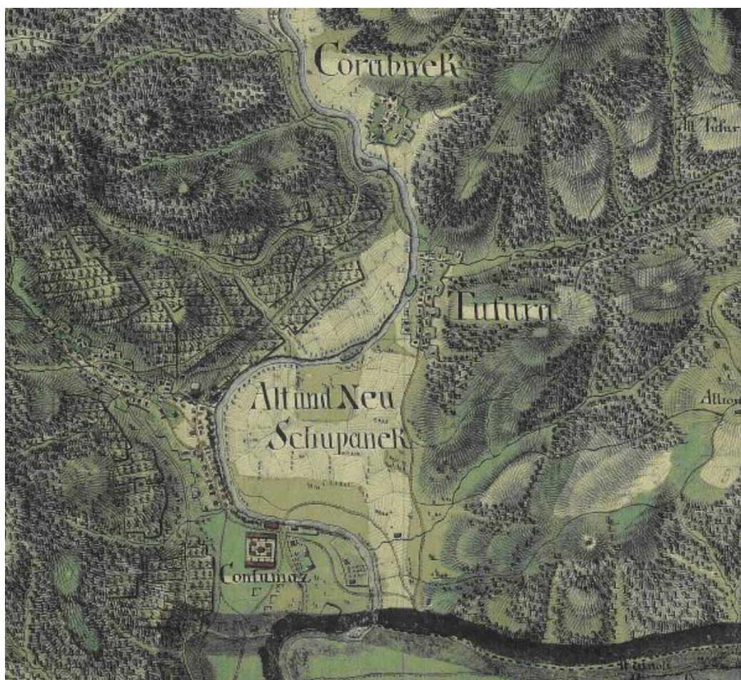
Fig.2. Detaliu Hartă-Prima Ridicare Josefină

-sectorul din nord, pe partea dreaptă a Cernei, vizavi de satul Tufări, între vadul Tătărescu și vărsarea pârâului Iznic, unde Jupalnicul avea majoritatea terenului, dominat de lunca cu arini, o mică parte aparținând de Tufări și de Coramnic;