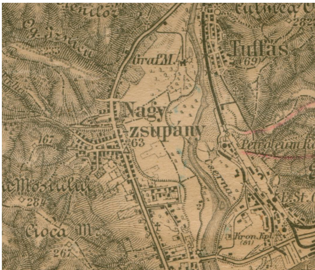
Fig.5. Detaliu Hartă (cca 1900) realizată după a treia ridicare (1868-1880, Franzisco-Josephinische Landesaufnahme)