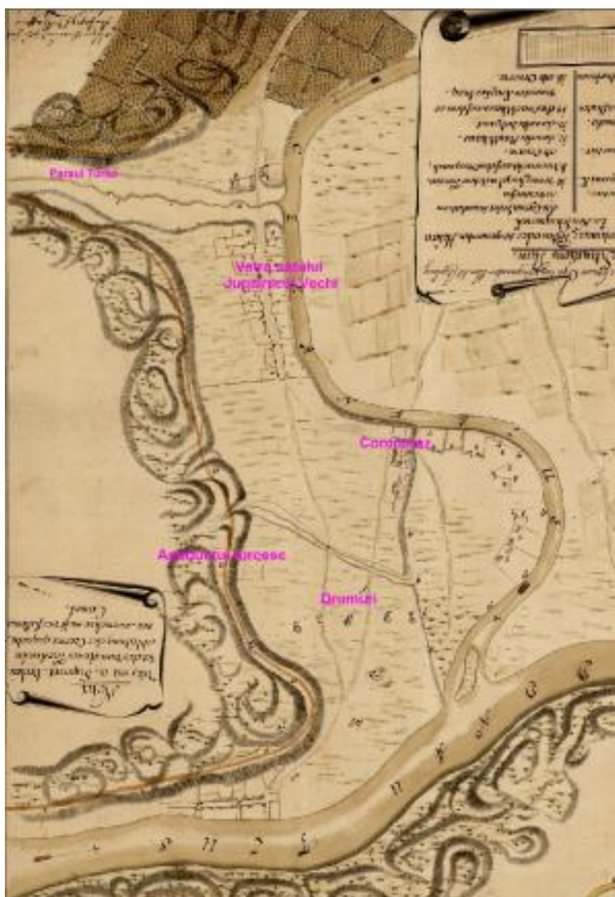
Fig.1. Detaliu hartă pentru redarea împrejurimilor Lazaretului de la Jupălnic

Prima hartă prezentată (Fig.1), deși nu este și cea mai veche, este un detaliu după harta realizată de Joseph Zeller pe la începutul secolului XIX, pentru redarea împrejurimilor