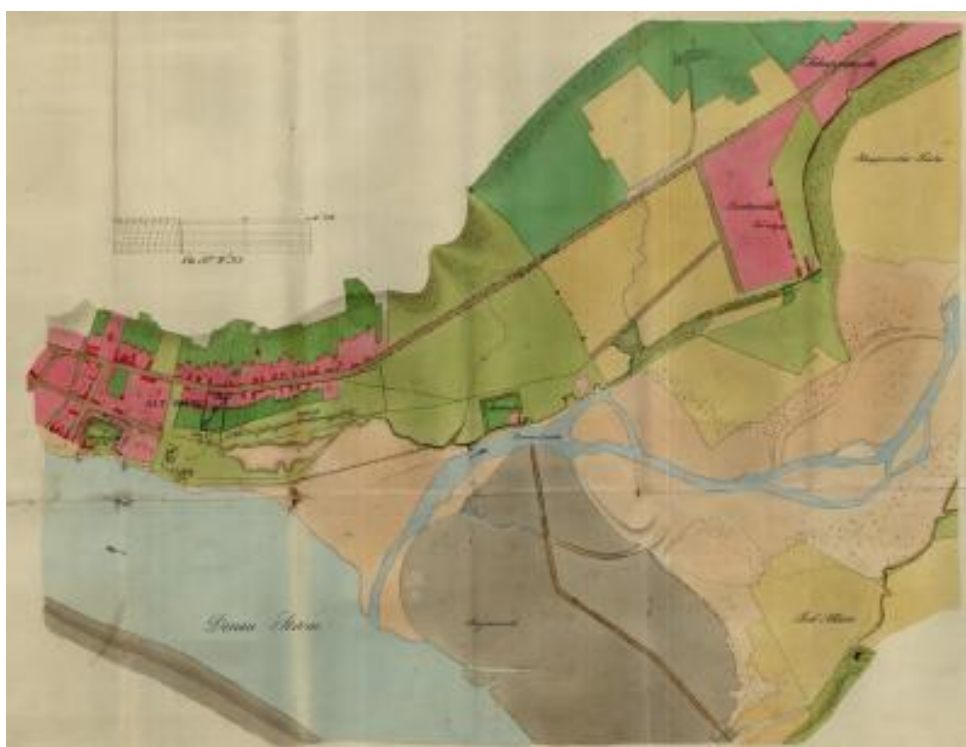
Fig.3. Detaliu plan cadastral Orșova-Jupalnic

Între timp, ofițerii ingineri topografi ai Regimentului de graniță au elaborat planuri cadastrale pentru localitățile principale (de exemplu, în 1816, primul plan cadastral pentru Orșova). Într-unul din planurile cadastrale refăcute în 1837 pentru interfața Orșova-Jupalnic situația este prezentată ca în detaliul din Fig. 3.