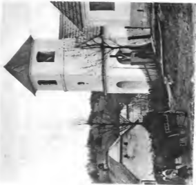
Kapelle in Lindenfeld Seite 77.