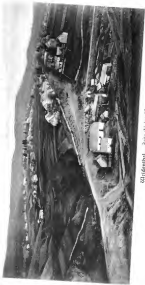
Weidenthal. Seite 23 bis 26.