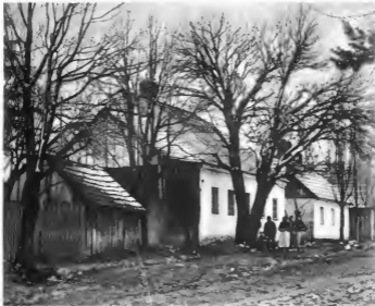
Bauernhaus in Weidenthal, neuester Art. Seite 75 u. 76.