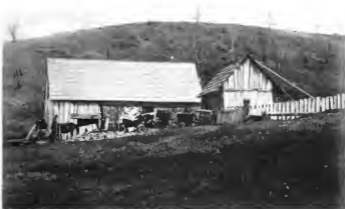
Salzd (Vorwerk) auf größerem Grundbesitz. Seite 74 u. 75.