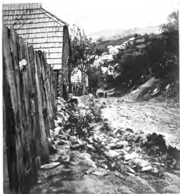
Lindenfeld. Seite 28.