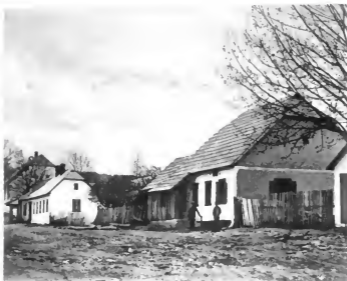
Gemeindehaus in Wolfsberg. Seite 76. Links, Bauernhaus.