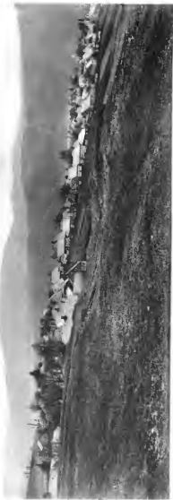
Wolfseberg. Seite 26 und 27.