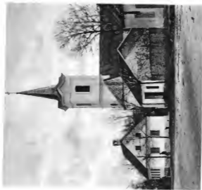
Kirche in Alt-Szadowa Seite 77. Pinte, Paternburg.