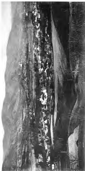
Hlt-Szadowa , Seite 55 und 56. Am Hintergrunde Szatina, Seite 7.