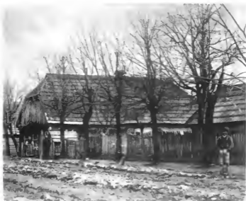
Gezimmertes Bauernhaus in Weidenthal. Seite 59 u. 60.