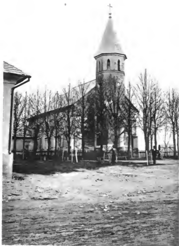
Kirche in Weidenthal. Seite 77.